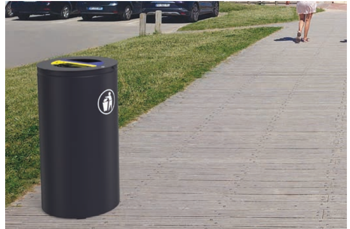
Corbeille PILA Tri sélectif - Réf. P1449