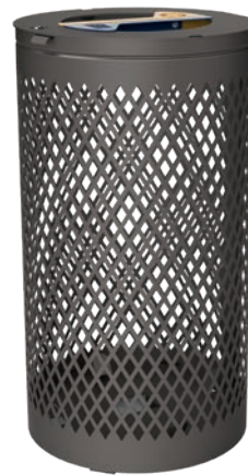
Corbeille PILA Tri sélectif Réf. P1448