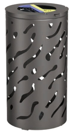
Corbeille JUSSAC Tri sélectif Réf. P1450