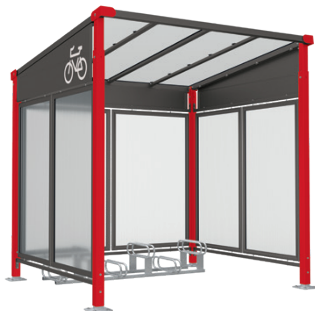
Réf. P1666 + P1662 + P1479 + P1481