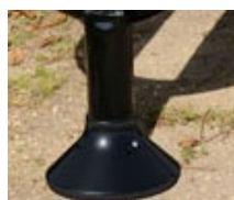
Embase décorative P1033