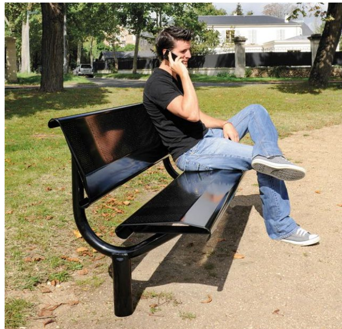
Référence : P1030