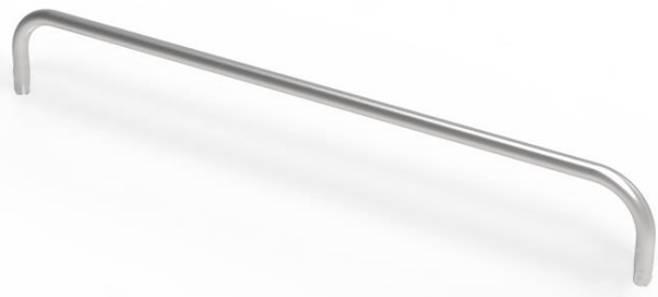
C4130 – Acier galva brut