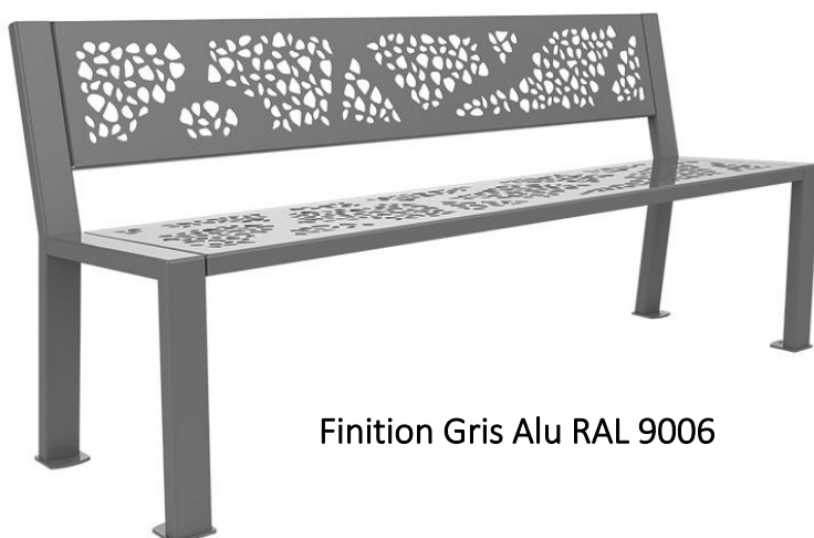
Finition Gris Alu RAL 9006