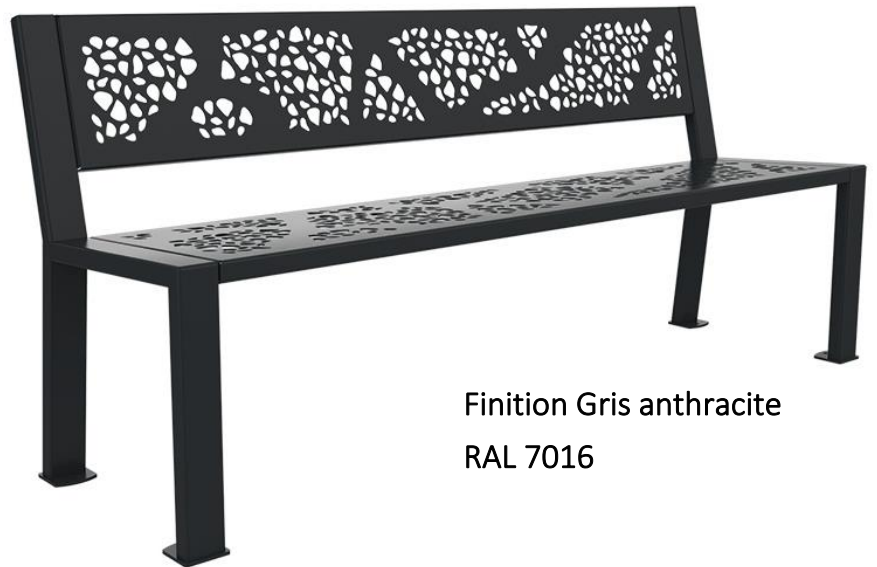
Finition Gris anthracite RAL 7016