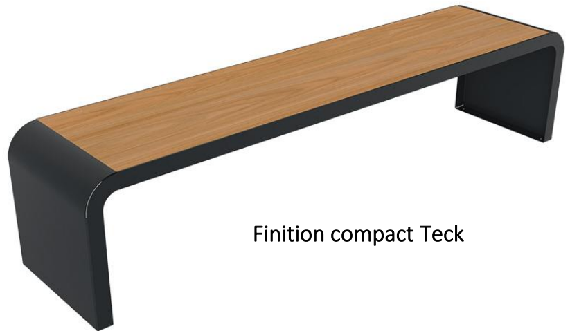
Finition compact Teck